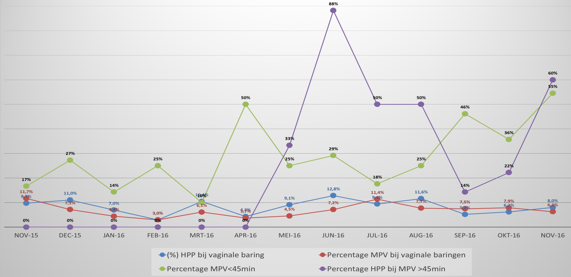
Manuele Placenta Verwijdering (MPV) en HPP